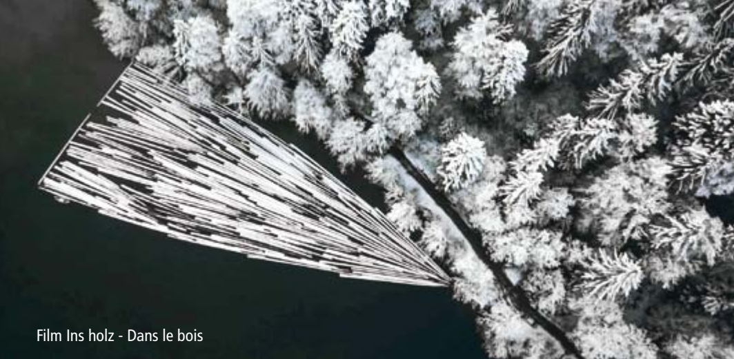
Film Ins Holz - Dans le bois